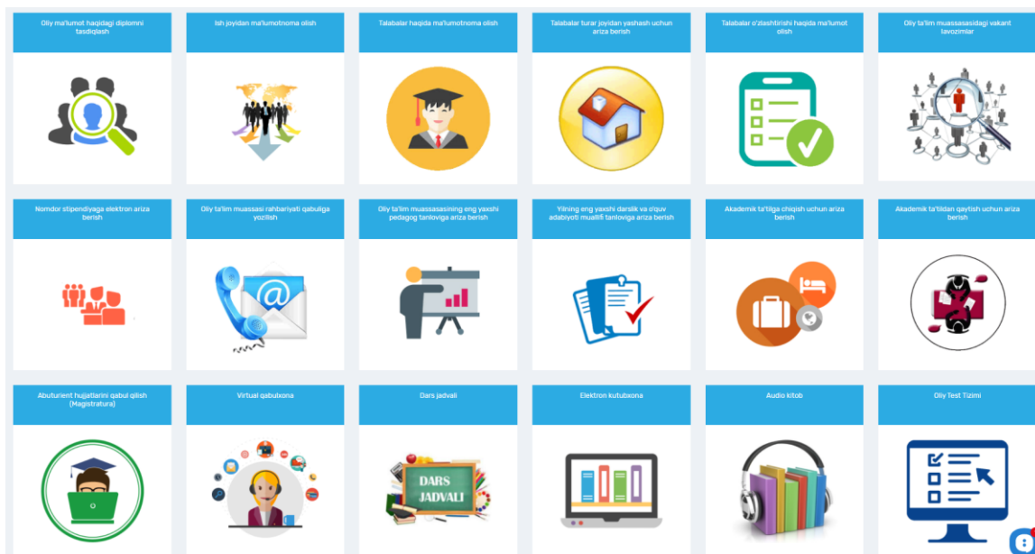
1-rasm Interaktiv xizmatlar ro'yxati