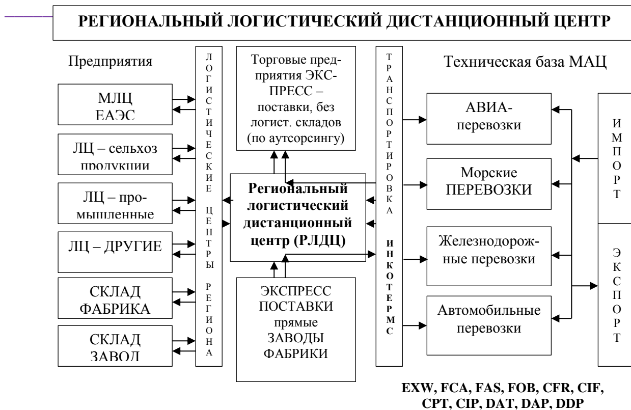
Рис. 4. Схема деятельности регионального логистического дистанционного центра (РЛДЦ)

Благодаря сведениям (диспетчерским) логистические центры не окажутся пустыми или перегруженными. С одной стороны, прибывший импортный груз не будет простаивать лишние часы, ожидая разгрузки, места и т.д. С другой стороны, МАЦ и его подшефные предприятия, получающие услуги аутсорсинга ВЭД, будут иметь любую информацию о наличии товара (собранного для дислокации) на логистических центрах для экспорта.