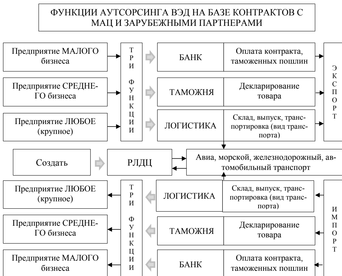
Рис. 3. Функции отдела аутсорсинга ВЭД МАЦ

Отдел аутсорсинга ВЭД на основе МАЦ, имея широкомасштабную базу данных о международной внешнеторговой деятельности, потребностях и предложениях посредством глобальных информационных услуг, в том числе конкретную информацию с помощью торговых представительств и собранной мониторинговой информации, информации специализированных предприятий и служб, других специальных отделов МАЦ, одновременно сможет вести аутсорсинг (в том числе дистанционный) сразу нескольких разноотраслевых предприятий, как полный, так и частичный (например, только заключение контрактов или декларирование, транспортировку), в соответствии с одной из трех функций отдела аутсорсинга ВЭД (рис. 3).